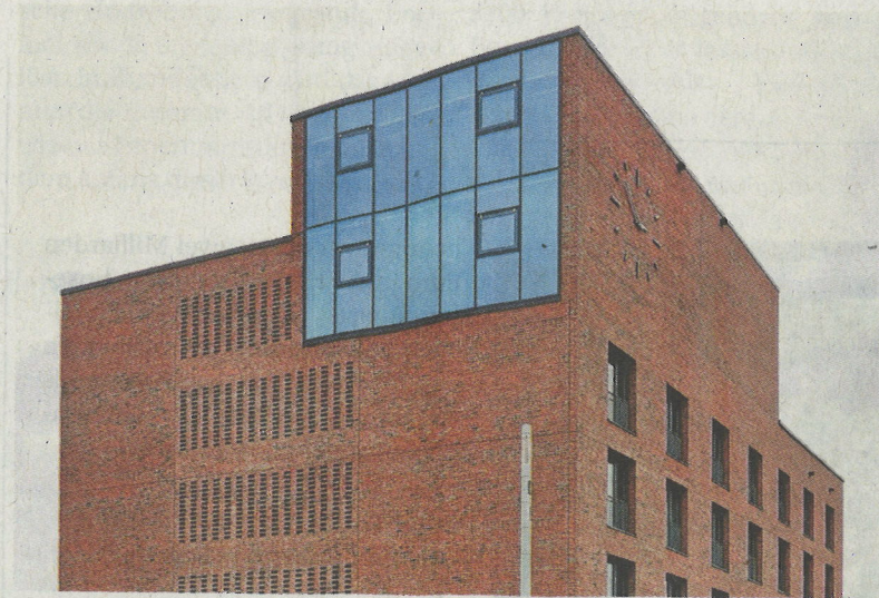
Auf dem Bild zu sehen sind die Rathausuhr sowie die hohen Fenster des Sitzungssaals. Er hat eine Deckenhöhe von rund sieben Metern, ist auf dem Bild oben von innen zu sehen.

Dieser sei beim Siegerentwurf „markant und schon von außen erkennbar“ und führe dazu, dass sich das Rathaus „deutlich von einem beliebigen Verwaltungsgebäude“ unterscheidet. Charakteristisch für den Entwurf seien „klare Linien und Formen und die klar gegliederte rote Ziegelsteinfassade“, so die Jury des Architekten Wettbewerbs. (ade)