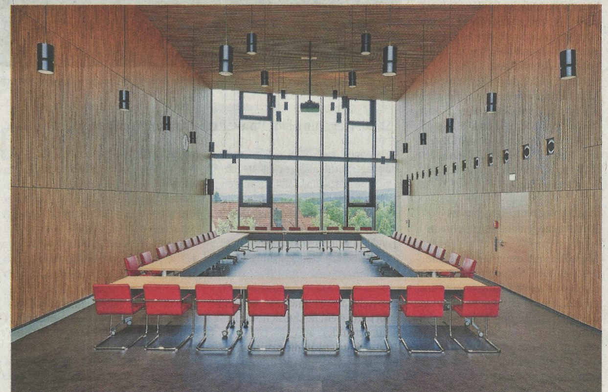
Die Deckenhöhe im Sitzungssaal beläuft sich auf sieben Meter. Die Wandverkleidung ist aus Eichenholz.