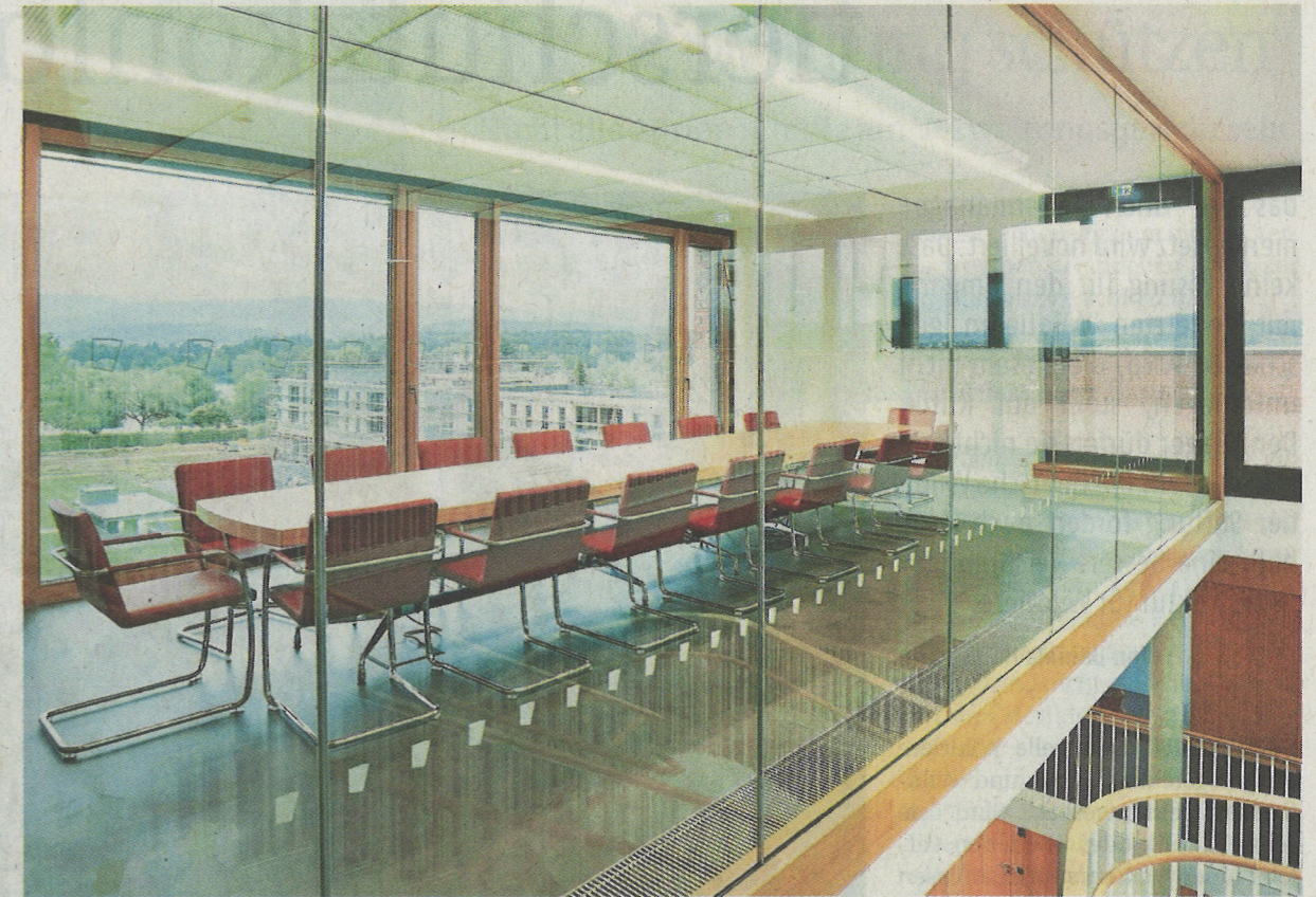
Im neuen Rathaus der Gemeinde Salem findet sich auf jedem Geschoss ein Besprechungsraum.

Baukosten: rund zwölf Millionen Euro Bauzeit: 2/2018 bis 4/2020 Fläche Neubau: 2700 Quadratmeter Fläche Tiefgarage: 3000 Quadratmeter